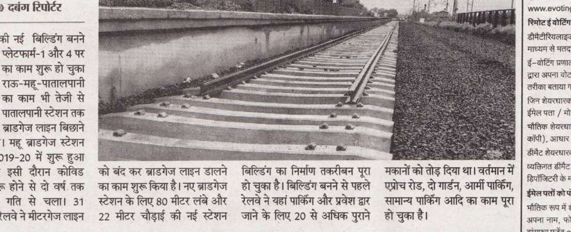
महू » दबंग रिपोर्टर

स्टेशन की नई बिल्डिंग बनने के बाद अब प्लेटफार्म-1 और 4 पर ट्रैक बिल्डिंग का काम शुरू हो चुका है। वहीं राऊ-महू-पातालपानी दोहरीकरण का काम भी तेजी से चल रहा है। पातालपानी स्टेशन तक दिसंबर तक ब्राडगेज लाइन बिल्डिंग का लक्ष्य है। महू ब्राडगेज स्टेशन का काम 2019-20 में शुरू हुआ था, लेकिन इसी दौरान कोविड संक्रमण शुरू होने से दो वर्ष तक काम धीमी गति से चला। 31 जनवरी को रेलवे ने मीटरगेज लाइन