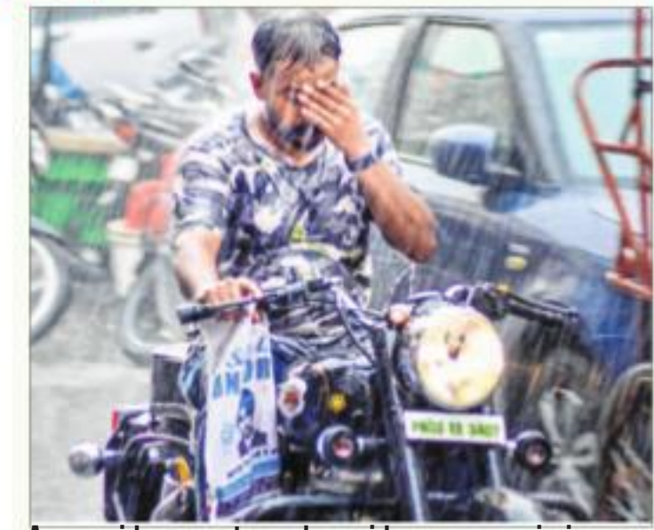
A man rides a motorcycle amid monsoon rain in Amritsar, on Monday