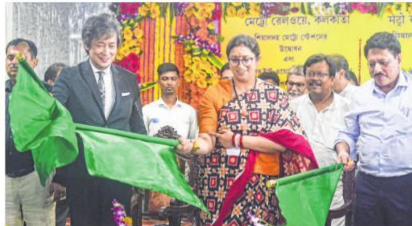
Union Minister for Women and Child Development Smriti Irani virtually inaugurates Sealdah Metro station of the East-West Metro corridor, at Howrah Maidan Metro station in Howrah, on Monday

The next day, the agency had arrested 14 people including six serving officials of the ministry after searches at 40 locations in a countrywide crackdown. The agency has not included the names of two arrested accused in the charge sheet as the probe has been kept open, they said.